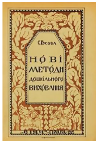
Наукові праці Софії Русової