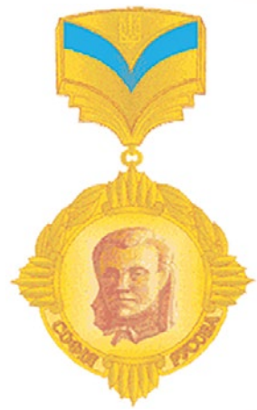
Нагрудний знак "Софія Русова"

до широкого, високого, до корисного для цілого масового щастя". Педагог стверджувала, що моральне виховання "не може проводитися якось окремо: ним має бути пройняте все навчання, все життя".