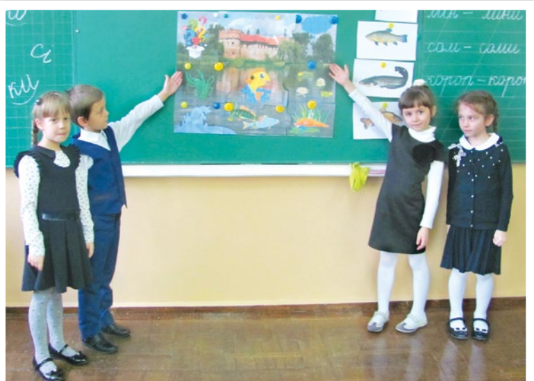
Нас пазли впевнено провадили до знань. З'явивсь пейзаж. Не стало запитань.

Приготуймо наші руки — Чарівні хай зринуть звуки: Звуки Баха, звуки Ліста. Ми ж — відомі піаністи.