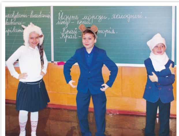
Годі мерзнути, звірята, Зігріванці час почати!

Йдуть морози, холоднечі, літу — край, Щоб зігрітись, танцювати починай, Тупу-туп, танцюєм танці, Тупутанці-зігріванці, Тупу-тупу через поле, через гай!