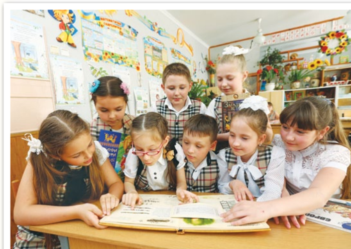
Структури тексту побудуємо модель, А трохи згодом план його складемо.