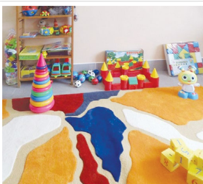
Правильно облаштоване освітнє середовище — запорука комфортного перебування учнів у школі.

Для цих занять можна використовувати будь-який природний матеріал: жолуді, каштани, засушені ягоди горобини, горіхи. Дитині пропонується спочатку посортувати змішаний матеріал обома руками. Поступово завдання ускладнюють, пропонуючи взяти однією рукою кілька предметів водночас, а далі діти мають брати одночасно обома руками різні предмети тощо.