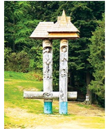
Пам’ятний знак “Синь і Вир”

Молодий легінь Вир вівчарив на полонині. Хоч і було йому там привільно, але він сумував за кохану, яку за волошкові очі називали Синь. Якось уночі вирішив легінь провідати її, але лісовий розбишака Чугайстер заманив вівчаря на стрімку скелю, і той у пітьмі зірвався в прірву. Коли Синь довідалася про його смерть, то гірко заплакала, і з тих сліз зробилося озеро. Посередині його видніється острівцець — зіниця ока дівчини, бо вона й досі виглядає коханого.