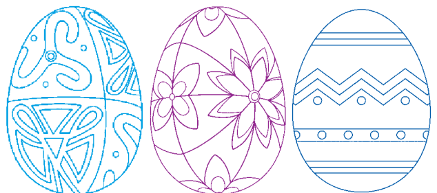
Шаблони писанок для розфарбовування

Відповідь: 1 — червоний, 2 — жовтий, 3 — зелений, 4 — блакитний, 5+6 — чорний та білий.