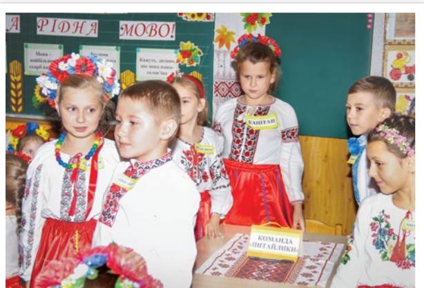
Працюємо в стратегії "Джингсоу" — Про Пчілку наша група має слово.

(Надіслала Н. Нарчинська, СШ № 1, м. Жашків, Черкаська обл.)