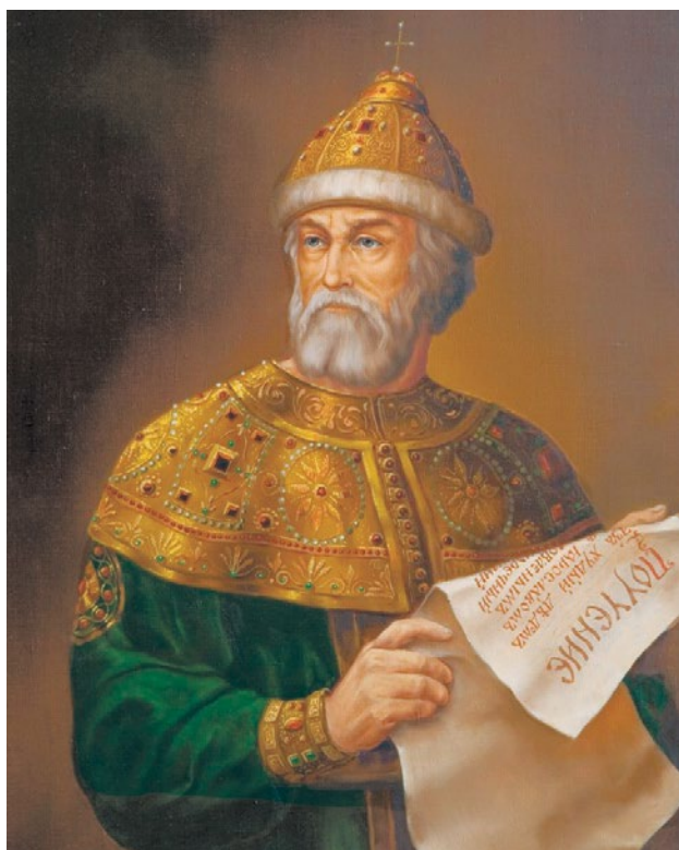
Володимир Мономах (автор невідомий)