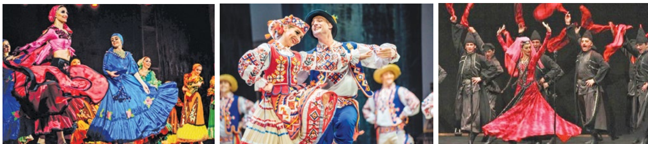
Народні танці: 1 — циганський; 2 — український; 3 — грузинський

за допомогою міміки і жестів, мають ефектні костюми, танцюють “на пальчиках”).