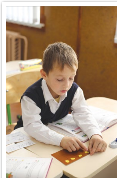
Завершення уроку за хвилину, Тож полічу зароблені зернини.

Учні записують у зошит добутки з попереднього завдання у порядку зростання й озвучують результат. За правильну відповідь кожен учень отримує одну зернинку.