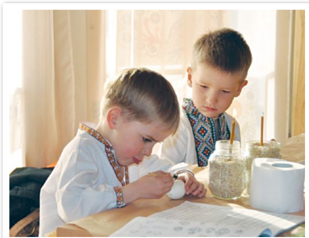
Запрацює писачок — віск розтопить свічка. Буде моя писанка гарна, наче квіточка! (Надіслала Г. Остапенко, м. Київ)

У Софійському соборі в Києві у 2010 році відкрили мозаїчне панно із зображенням Пресвятої Богородиці, складене з 15 тисяч розфарбованих українцями писанок.