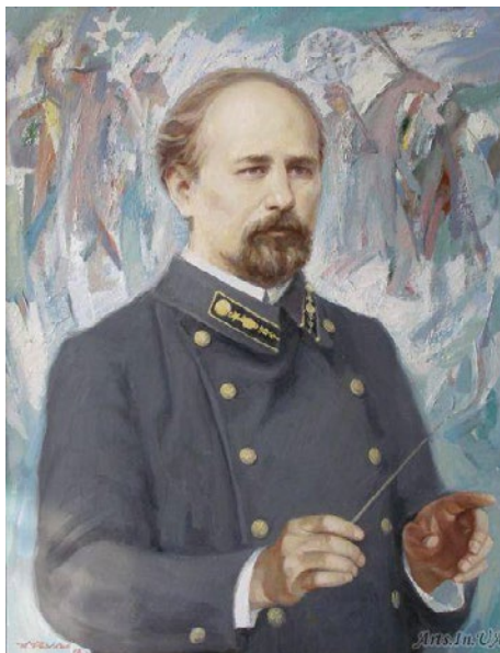
Композитор Леонтович.