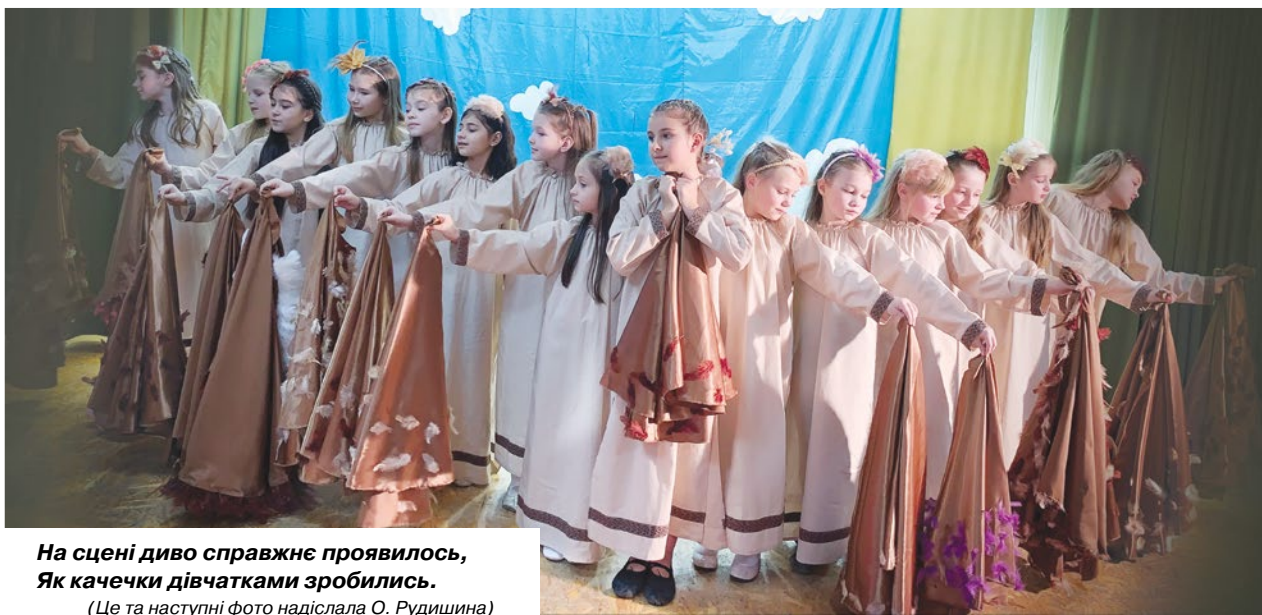
На сцені диво справжнє проявилось, Як качечки дівчатками зробились. (Це та наступні фото надіслала О. Рудишина)

Результати проекту було презентовано у формі театральної вистави. До її підготовки долучилися діти з ООП — вихованці Вінницького обласного центру соціальної реабілітації дітей з інвалідністю “Промінь”. Така співпраця посилює рефлексивну реакцію дітей, активно сприяє розумінню ними власних можливостей, збагачує досвід доцільної діяльності молодших школярів у соціумі; а також — сприяє соціалізації дітей з ООП, забезпечує умови для розкриття їхніх обдаровань, підвищує самооцінку й мотивацію.