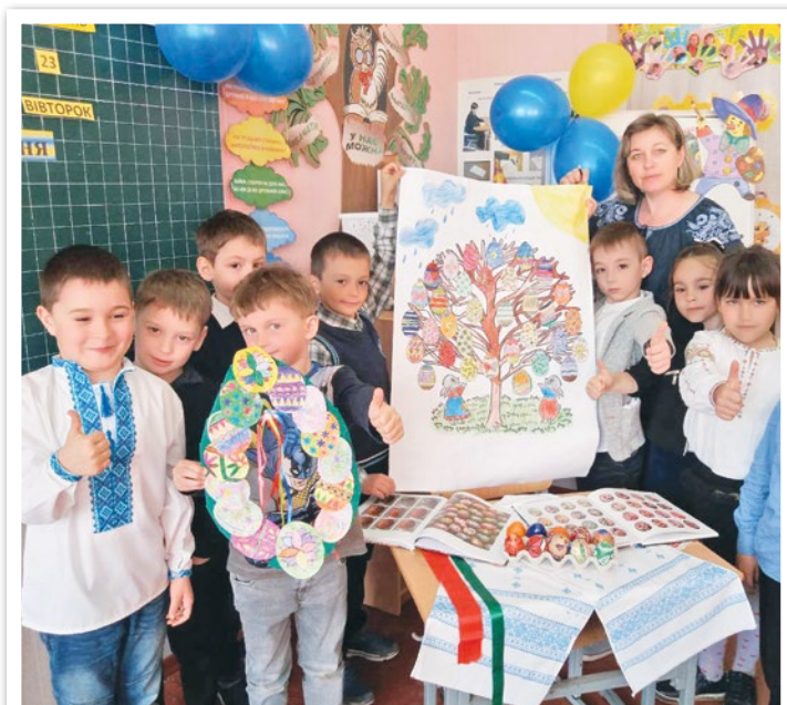
Це дивина — на Великоднє свято Із писанок розквітли деревцята.

Добірка інтерактивних вправ з теми “Космос”