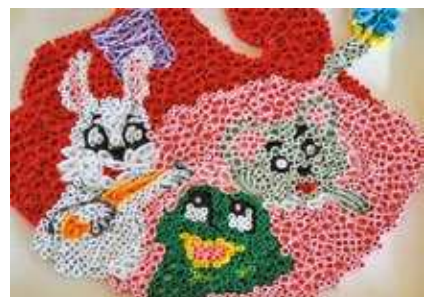
Зразки готових виробів