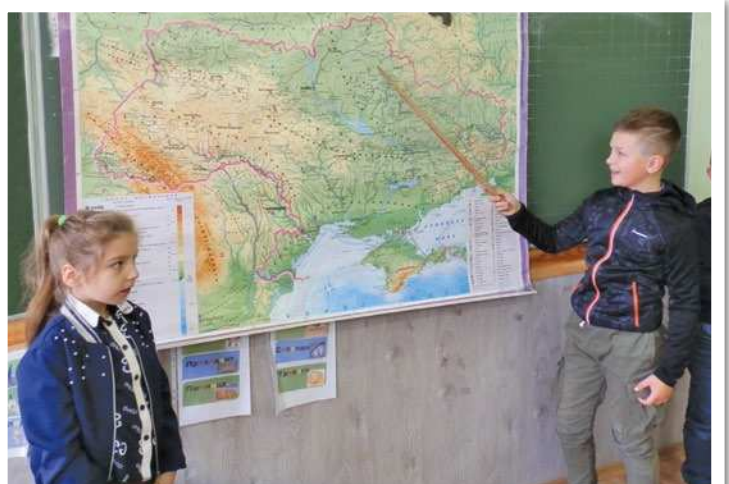
Ми мандрувати любимо, тож в турагентство граємо. Щоб Україну вивчити, маршрути прокладаємо. (Надіслала І. Ганжа, с. Велика Димерка, Броварський р-н, Київська обл.)