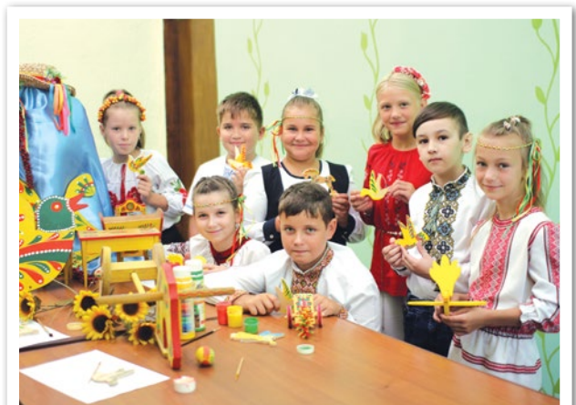
Вдяглись птахи у яворівські візерунки, Тож понесемо рідним подарунки.