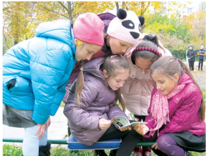
Доки приємна осіння погода Книжечку можна читати на природі.