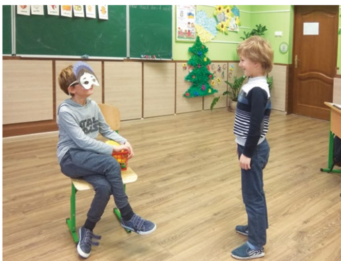
У нас в запасі різні є прийоми, Щоб діти вчилися і не знали втоми. (Це та наступне фото надіслала О. Ключіньська, м. Львів)

The itsy-bitsy spider (Крихітний павучок) Climbed up the water spout. (Піднімався по ливні). Down came the rain (Пішов дощ) And washed the spider out. (І змив павучка донизу).