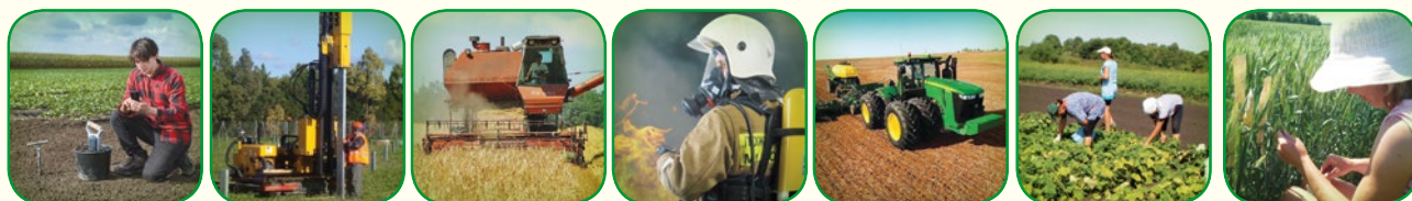
Картки до гри “Лото”