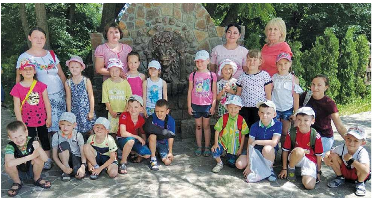
Літо. Екскурсії. Табір дитячий. В похід вирушаєм, бо ми не ледачі.