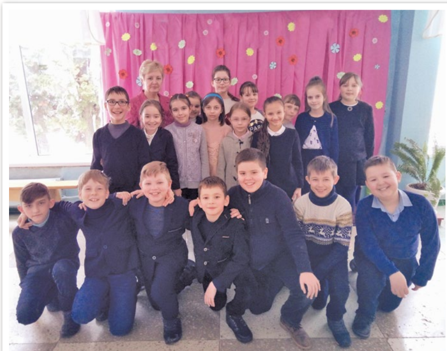
Вебміст сьогодні. Отже, можуть діти Поспілкуватись, щось обговорити.

Сьогодні ми познайомимось з цим поняттям ближче, розглянувши різні життєві